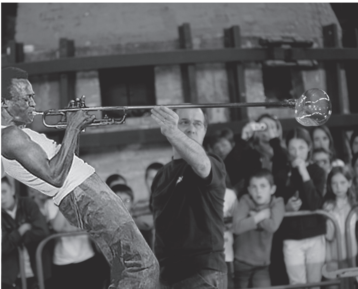
Anima con sordino / Simulation / 2015 /

** L'Atelier Nantes est un atelier artisanal de lutherie et réparation d'instruments à vent.