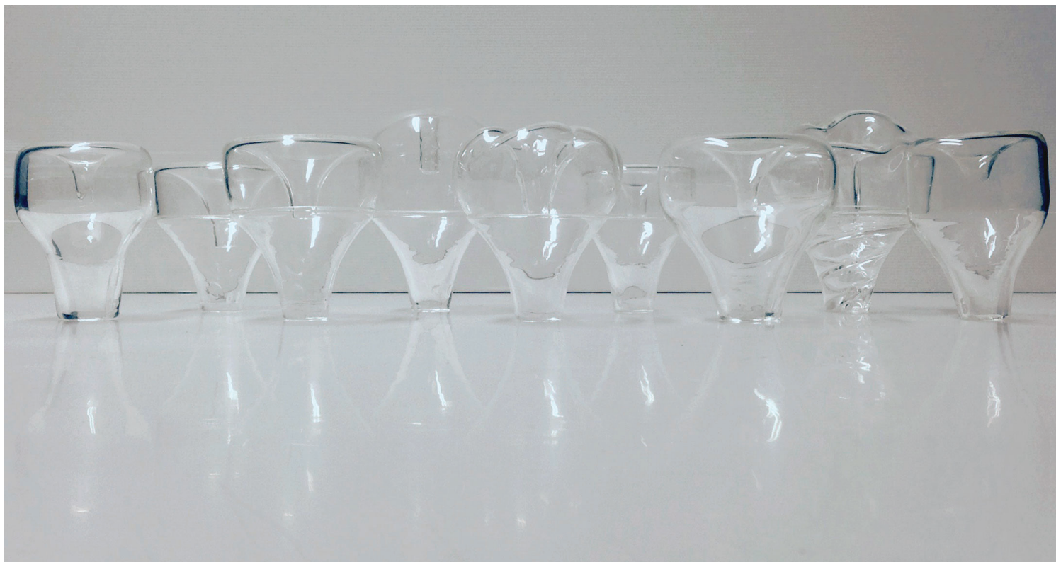
Harmons and WahWahzes, 9 prototypes de sourdines en verre soufflé modèle Harmon / juillet 2016