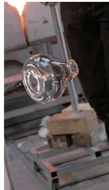
Prototype sourdine soufflée modèle Harmon / mars 2016