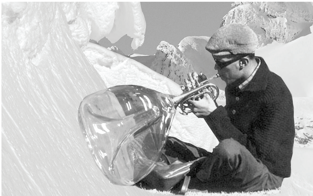
BigWahWah#002-Tribute to Don Cherry / 2016

«Icy est le confin de la mer glaciale, sur laquelle feut, au commencement de l'hyver dernier passé, grosse et félonne bataille entre les Arismapiens et les Nephelibates. Lors gelèrent en l'air les parolles et crys des hommes et femmes, les chaplis des masses, les hurtys des harnaoy, des bardes, les hannissements des chevaulx et tout aultre effroy de combat. A ceste heure, la rigueur de l'hyver passée, advenente la sérénité et tempérie du bon temps, elles fondent et sont ouyes.» «Les paroles gelées», in Le Quart Livre de François Rabelais.